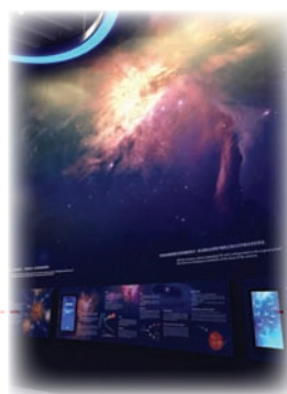
■ 上海自然歷史博物館新館壁畫(右圖)由惠普 Latex 3000(左圖)打印機印製。