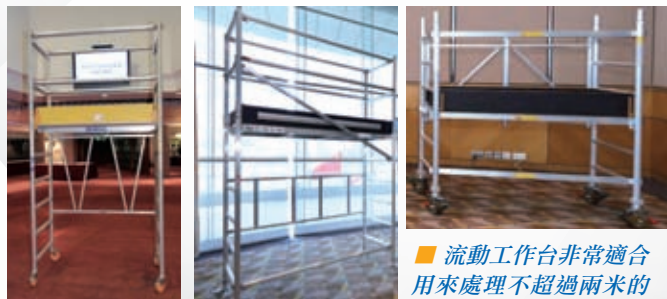
■ 流動工作台非常適合用來處理不超過兩米的離地工程，既實用又可確保工作人員安全。