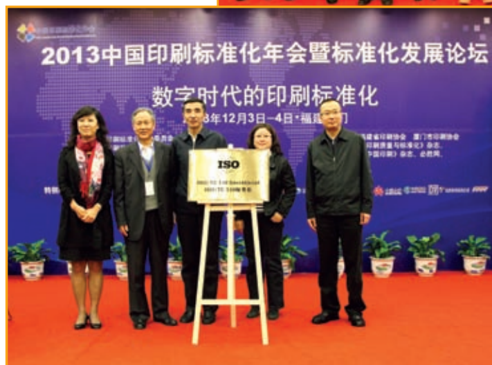
■ ISO TC130 秘書處正式揭牌，由全國印刷標準化技術委員會承擔其工作。