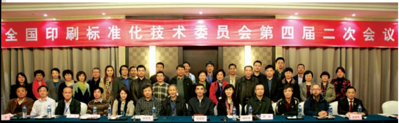
■ 全國印刷標準化技術委員會於2013年12月2日在廈門召開第四屆第二次會議。