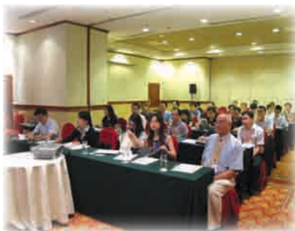
■ 這次高級研修班吸引了31位學員報讀，反應理想。