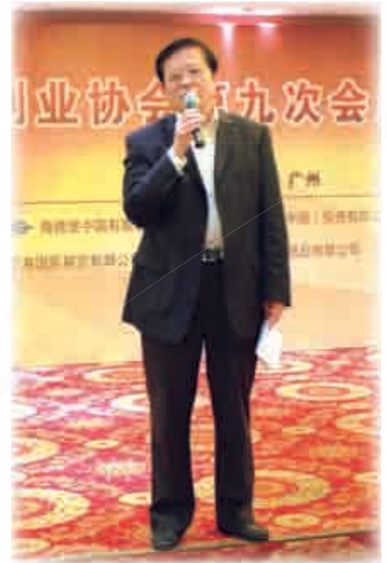
■ 廣東省新聞出版局朱仲南局長在聯歡晚會上致辭。