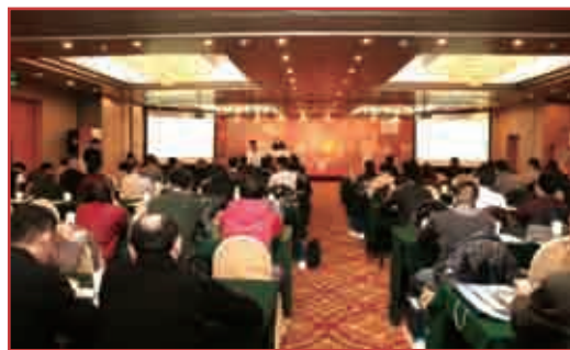
曼羅蘭「增值印刷在中國 2012」系列活動最後一站，在北京圓滿舉行。