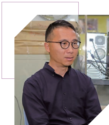
黎老師希望學生能按自己的興趣選科升學，並盡力發展所長。