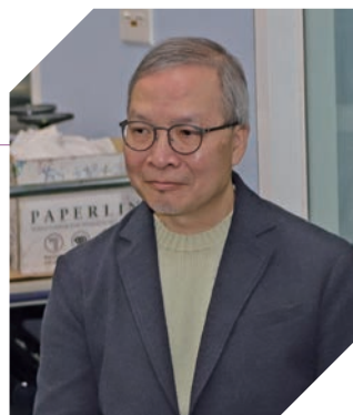
陳老師同樣希望學生能繼續升學，揀選自己喜歡的科目、享受整個學習過程，不要給太大壓力自己。

負責教授電腦軟件使用的陳老師表示，最重要是用心觀察和耐心教導，也可通過於課餘時間和學生補堂，進一步了解他們在學習上的需要。陳老師表示，學生的主動性很強，而且一些基礎較好的學生亦會主動幫忙教一些基礎欠佳的學生。在三年制的課程中，陳老師非常樂於見證學生一步步成長，並在軟件應用上慢慢成熟到可以落實自己的設計意念。