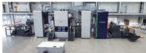
■ 高寶已有客戶引入 RotaJET 商業噴墨印刷機。

03 高寶 RotaJET 數碼印刷機在 SIG 成功安裝並應用於液體產品包裝紙箱印刷，這是繼北美利樂包裝引進超高性能印刷機之後承接的第二筆重點投資。該數碼印刷系統的印速高達每分鐘 270 米，能夠應對多種不同幅面寬度。系統與無菌紙箱的生產工藝流程配合，滿足 SIG 包裝盒的轉輪印刷和摺痕輓或厚紙板傳輸。快速模具更換可以很有效地配合快速印版更換，從而滿足短版活運行要求，無需再使用凹版印刷機印製此類活件，同時節省滾筒準備成本。