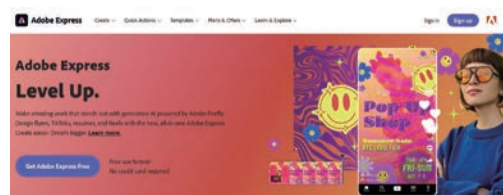
■ Adobe Express 有多種創新功能，支援用戶更快速、輕鬆地設計媒體內容。