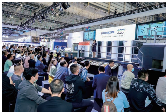
■ LITHRONE GX40RP advance 向 Print China 觀眾展示了一次送紙雙面印刷、快速作業轉換的特色。

作為商業印刷解決方案，40英寸8色單張紙膠印機 LITHRONE GX40RP advance 在一次送紙雙面印刷方面具有壓倒性優勢，可以大幅度提高產能