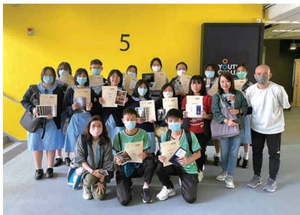
蒙民偉書院學生全情投入參與 APTEC「手工書／Photo Zine 製作工作坊」的不同活動。

APTEC 與光影作坊合作，於2023年3月至4月期間，為中華基督教會蒙民偉書院開辦為期23小時「手工書／Photo Zine 製作工作坊」，內容非常豐富，由彭安琪總監講解印刷的範疇，並展示不同種類的印刷品（例如立體書、印刷配合 AR、印在不同物料的印刷品等），學生都愛不釋手；然後教導學生使用 Photoshop 和 InDesign 製作個人手工攝影集，以及參觀宏亞印刷，以了解整個生產流程；最後一節就是將學生作品即場以數碼印刷印製，並根據印刷拼大版方法摺成書、切紙和自行釘裝。學生親身體驗整個流程，均表示獲益良多，令他們改變對印刷的觀念，甚至有學生說：「沒有想過印刷廠原來那麼乾淨」，更深刻體會到印刷確是無處不在。