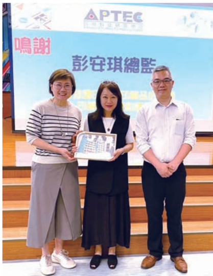
■ APTEC 為堅樂第二小學舉辦的活動「書的誕生與創作：從一棵樹到一本書」獲得好評。