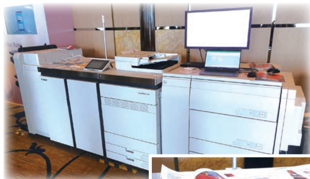
■ 場內最令人眼前一亮的生產型印刷系統——imagePRESS V1000 提供廣泛應用範圍，從小冊子、名片、信封到各類創意設計的宣傳品皆可按需打印。

除了印刷設備外，佳能香港推出 uniFLOW 的 CRD Printing Module 管理方案，透過線上平台集中管理打印作業流程，無需額外安裝工序。有見客制化產品大受歡迎，Quadiant Inspire 客戶溝通管理方案利用大數據分析客戶群特性，協助印刷企業緊貼市場變化，拓展商機。