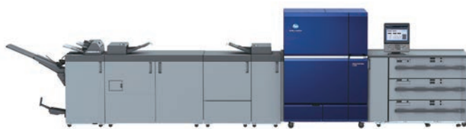
■ AccurioPress C14000 系列高度自動化，可減少人工工序，顯著減少浪費，達到高質量生產力。