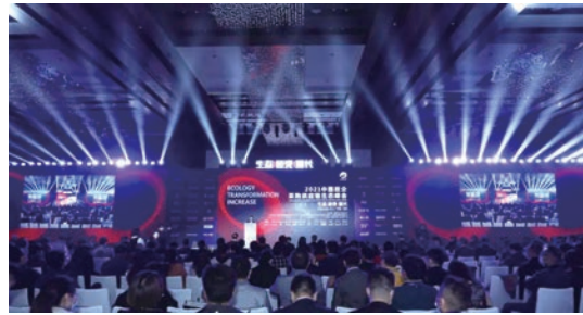
■ 芬歐匯川積極參與 2021 中國政企採購供應鏈生態峰會。

這次峰會以「生態 | 智鏈 | 增長」為主題，有超過 1,200 個政府物流及信息化部門、相關企業，以及行業協會、院校、研究機構參與，探討在數字化轉型中，採購供應鏈的發展現狀與未來趨勢。在峰會現場，UPM 的展位吸引了眾多嘉賓關注和查詢，使其在政企採購產業鏈中的知名度也得以提升。