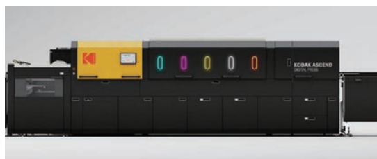
■ 柯達 ASCEND 數碼印刷機是第一台針對大克重承印物的長印量靜電數碼印刷 (EP) 印刷機。

柯達印能捷按需 Access 系統可與數碼印刷機連接，具備 Microsoft Azure 支援的安全性和高可擴展性；印能捷按需 Access 擁有預檢、色彩管理、文件管理、備份和路由功能；內置的柯達印易通印前端口功能，支援文件提交和遠程客戶協作等。