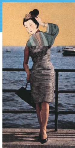
■ 石漢瑞先生於 1965 年為《The Asia Magazine》設計自家廣告，將古代與現代女性的影像形成鮮明對比。

石漢瑞先生是業界的先鋒，為香港多家企業創作品牌標誌、廣告、年報等，參與了香港五六十年的設計發展，創造了眾多別具代表性的設計，塑造了深入民心的香港視覺景觀。他為匯豐銀行、香港置地和香港電話公司設計的視覺識別系統，既時尚、言簡意賅而又國際化，充分反映香港經濟起飛時期對實用和精緻的追求。他設計的渣打銀行鈔票既保留香港的傳統文化特色，同時展現香港與時並進、放眼全球的一面。總括而言，石漢瑞先生的作品充滿睿智而精準，既富現代感，同時反映本土文化的底蘊，內涵豐富，歷久常新，不落俗套。