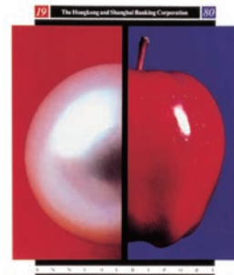
展覽中的「象徵」展區展示了石漢瑞先生為香港匯豐銀行設計的 1980 年年報封套。