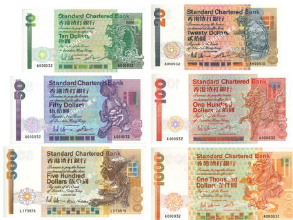
■ 這套渣打銀行鈔票出自石漢瑞先生的手筆，採用中國神獸為主題，神獸間的等級暗示各鈔票面值的等位。