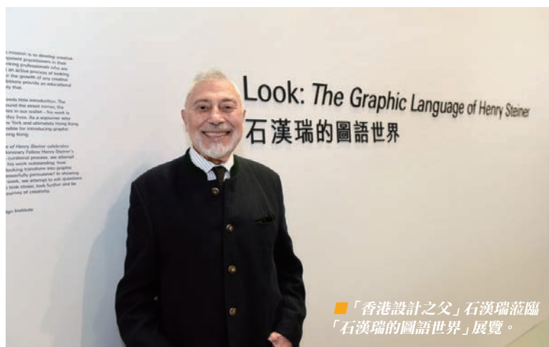
「香港設計之父」石漢瑞蒞臨「石漢瑞的圖語世界」展覽。

在「看見」的過程中，不但需要用心細閱，還要積極尋問。參觀者可在這次展覽中，透過石漢瑞先生的作品與思考方式提出詰問，挑戰在日常生活中對視覺訊息的固有觀念；回溯他過去 60 年的代表作品，又可重見香港著名企業品牌形象的起源，並看到香港不斷發展進步的