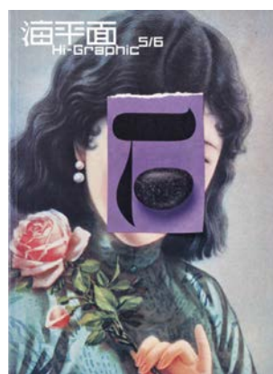
■ 石漢瑞先生應邀設計《海平面》雜誌第五期封面（1999），玩味地將「石」字色紙貼在阮玲玉臉上，向上海設計界介紹自己。

在未來日子，IPP 將為會員及同業舉辦更多既增值又有趣味的活動，現誠摯邀請同業成為會員。有關加入 IPP，請瀏覽： www.ipp.org.hk