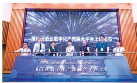
「2021海峽兩岸經貿論壇」正式發佈「廈門製造業數字化產教融合平台」。

為更有效地對接產教兩方，平台還為企業和院校分別開通了合作入口。企業主要側重在人才服務、技術服務、院校對接、知識沉澱等方面，院校則從產業學院、教學服務、企業對接、課題合作等方面進行整合。■ 資料來源：東南網