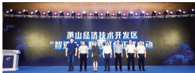
蕭山的製造業數智提升三年行動計劃，旨在推行數智化改革。