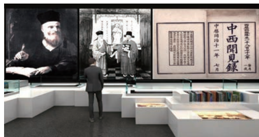
■ 中國近現代新聞出版專業博物館建成後的預測內部效果圖。