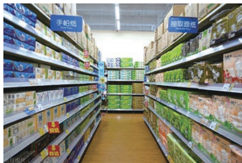
■ 中國生活用紙主要依靠國內生產。