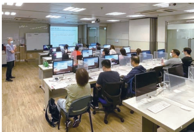
■ APTEC 的 ePub 3.0 電子書製作課程為出版社而設，反應理想。

電子書訂立了ePub 3.0標準，能夠在InDesign直接輸出符合標準的電子書，但從業員在製稿時仍需要留意製作電子書的要點。ePub 3.0能夠兼容互動和多媒體的內容，以及固定頁面和流動頁面的格式。今年，APTEC獲邀為出版社同時開辦線上和線下課程，講解ePub 3.0的製作技巧和電子出版的概念。