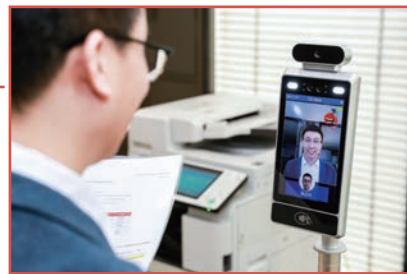
■「佳創空間」智能 IT 解決方案可應用於不同領域中。