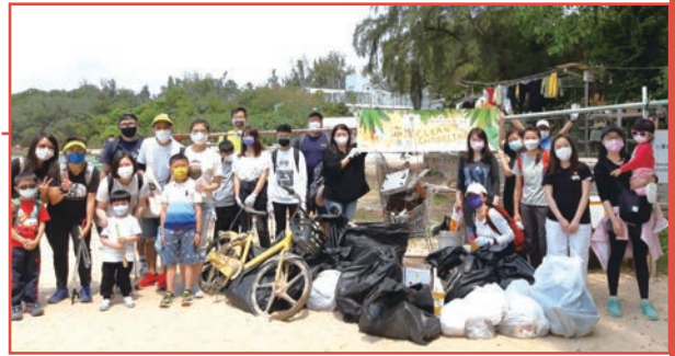
■ 利奧組織了海岸清潔大行動，為環保出一分力。

這次活動約有 50 位利奧員工、家屬及朋友一同參與，一眾義工分成不同小隊前往環境保護署建議的海上垃圾收集地點——烏溪沙渡頭灣村至青年新村海岸進行清潔服務。除被水流和潮汐帶到沿岸一帶的垃圾之外，他們還收集了很多煙頭、膠樽、鋁罐、食物包裝袋、棄置魚網及大型廢料等，這些垃圾很大機會是來自岸邊和海上的康樂活動。