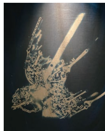
■ 《十一吉祥動物》用汽車零件及工具拼砌出十一瑞獸。

這次展覽展示 1940 年代至 2020 年的作品，展現大師的經典版畫及年青藝術家的最新創作，可以看到版畫概念如何與電腦動畫、立體打印、擴增實境等新媒介融合，亦能夠欣賞到版畫技巧如何應用於插畫、設計、小誌及文創產品等之中。