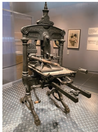
■ 1930 年代的 Albion 印刷機。