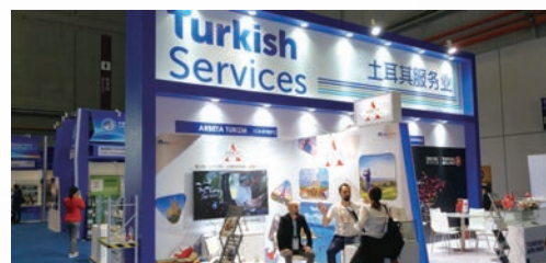
■ 中國國際進口博覽會的土耳其展館。

在進博會舉行期間，土耳其商家展出該國出口各種產品，包括農產品、食品及飲料、機械和服務等，受到中國買家熱烈歡迎。雖然土耳其出口商和服務供應商似乎都已認定中國可為其產品提供現成市場，但他們大多承認不熟悉內地法律法規，更不用說消費者喜好和分銷渠道方面的市場動態。