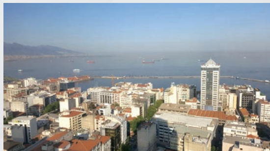
伊茲密爾位於土耳其西部，市內港口面向愛琴海。

土耳其也積極改善及發展新航運物流基礎設施，尤其是在伊茲密爾 (İzmir)。伊茲密爾有愛琴海明珠之稱，以人口計是該國第三大城市，也是北愛琴海錢達爾勒港 (North Aegean Çandarlı Port) 所在地。該港口建成後將成世界十大海港之一，每年的貨物處理能力高達1,200萬個20英尺標準貨櫃 (TEU)，預料可令土耳其的貨物處理能力提高70%。