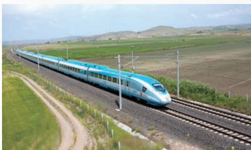
■ 伊斯坦布爾—安卡拉高速鐵路。

土耳其是古代絲綢之路的重要一環，順理成章也是當今絲綢之路經濟帶和海上絲綢之路的關鍵夥伴。事實上，早在「一帶一路」倡議出現前，土耳其與中國的合作便已不斷增多。2010年，土耳其興建高速鐵路連接愛第尼和卡爾斯兩市，中國提供280億美元貸款，在項目融資和建設中擔當重要角色。另外，中國鐵建股份公司和中國機械進出口公司則與土耳其的Cengiz Construction 和 Ibrahim Cecen Ictas Construction 合組財團，攜手興建伊斯坦布爾—安卡拉高速鐵路。