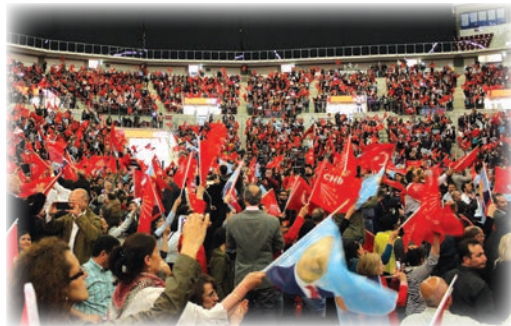
■ 2015年6月，土耳其執政黨僅獲得40%的選票，失去國會大多數控制權。