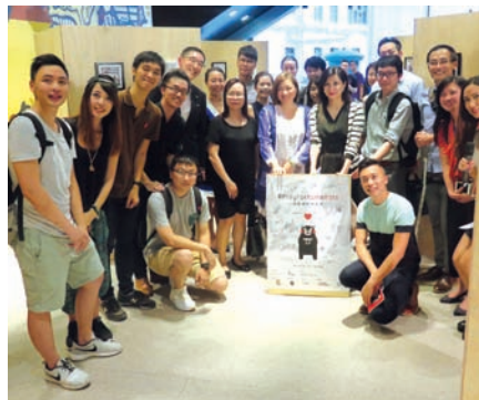
■ # PrayForKumamoto 慈善攝影作品展開幕儀式上，主辦單位及致生等一眾贊助商代表，聯同參與展出的 Instagrammers 及觀展人士合照留念。

這個慈善攝影展由 BRANDELION 主辦，展出了歐美、亞洲等地的 Instagrammers 有關日本的攝影作品，希望藉著鏡頭下日本的美麗景色，幫助今年 4 月熊本地地震受災居民走出傷痛。同時在展覽期間，主辦單位也義賣這批攝影作品及相關的明信片，所得款項扣除成本後，全數捐贈予熊本縣市政府。■