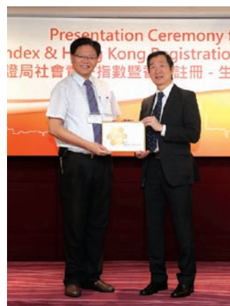
■ 香港質量保證局早前公佈了2015年度企業社會責任進階指數跨行業評審結果，利奧獲得87.3分(滿分100分)，連續兩年位列工業類別榜首。

香港質量保證局(HKQAA)於1989年由香港政府工業署創立，是一所認可的獨立評審機構。2015年度企業社會責任進階指數跨行業評審，總共有698間來自不同行業的企業參與。利奧在這次評審獲得87.3分，而同地區的其他參加者所獲平均分為46.3分，利奧不單脫穎而出，相比本身往年的結果(80.1分)亦有所提升。報告結果顯示，利奧在社區參與和發展方面有突出的表現，而在公平營運、環境責任、人權的範疇亦持續改善。