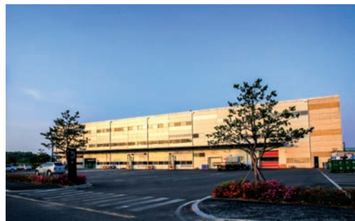
■ 韓國著名書刊印刷商 Young Shin Sa 公司為了更能配合業務轉變，決定一次過購置三台不同配置的曼羅蘭平張印刷機。