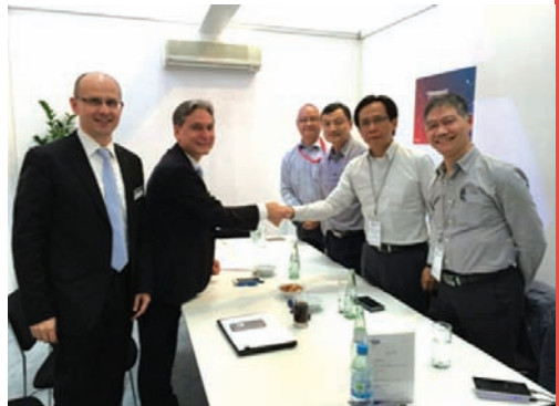
■ 高寶及中華商務代表進行利必達 105 單張紙膠印機的簽約儀式。

高寶在此次展會上收獲頗豐，尤其是中國市場表現良好。中華商務、鶴山雅圖仕等中國知名印刷企業均選擇與高寶合作。在高寶舉辦的中