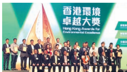
■ 中華商務獲頒 2015 香港環境卓越大獎優異獎。