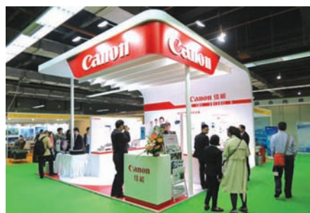
■ 佳能攜旗下多款產品參與了第七屆國際醫療器械展覽會，不少參觀者駐足展台，查詢產品詳情。

醫院護士站也擁有龐大的資料打印需求。佳能黑白激光打印機 LBP6780X 可以打印多種類型的資料，還支持大容量耗材，可實現最多 12,500 頁的文檔打印，無需頻繁購買耗材，有效為醫院節省支出。