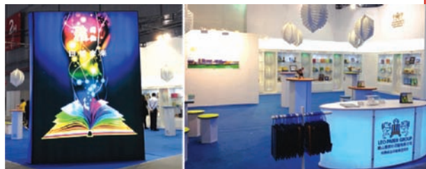
■ 2016 中國（上海）國際印刷周利奧展區。