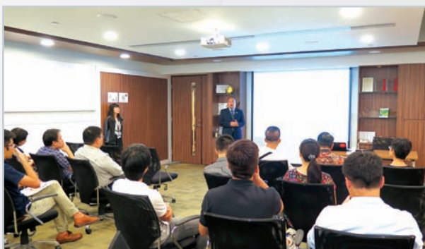
■ 與會者聚精會神地聆聽兩位講者的分享。

為滿足持份者對環保的要求，印刷企業首先要達到相關法律法規的減排、降低能耗及污染等要求；其次在生產及日常營運中，採用清潔、環境友好的技術及設備；最後，便可根據不同的環保議題，有針對性地制定公開報告，或以不同方式展示環保成果。綜合各方面行動，持份者才能清楚掌握並肯定企業的環保表現。■